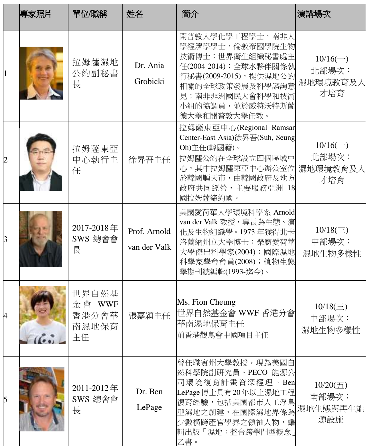
表 1 國際專家學者邀請名單列表